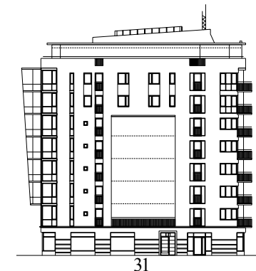
Punkthusets fasad mot Engelbrektsgatan