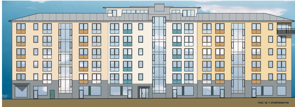
Vy från Järnvägsgatan

Dessa etapper omfattar 58 lägenheter. Inflyttning i etapper från feb 2005. Dessa lägenheter har adresserna Engelbrektsgatan 21, Järnvägsgatan 2 och Sparregatan 1.