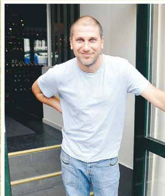
Markoolio är folkbär och har skrivit flera fotbollslåtar.